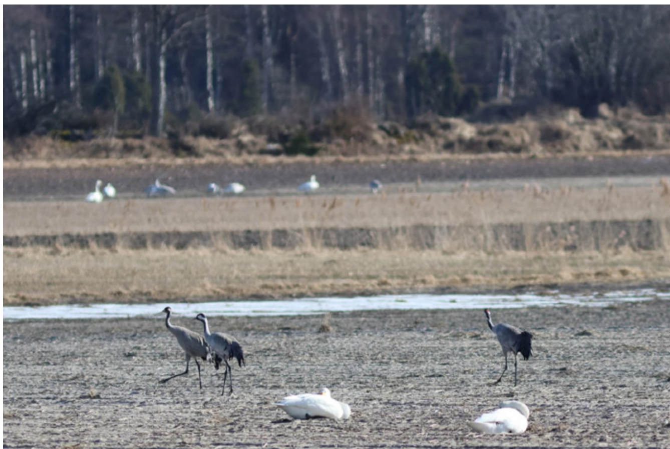
Vår på Gottby åkrar; Tranor och Sångsvanar